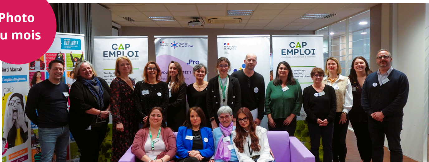
Photo du mois

La Gazette officielle de la Mission Locale Nord Marnais