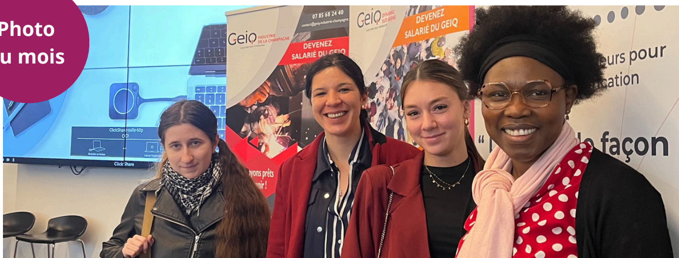
Photo du mois

La Gazette officielle de la Mission Locale Nord Marnais