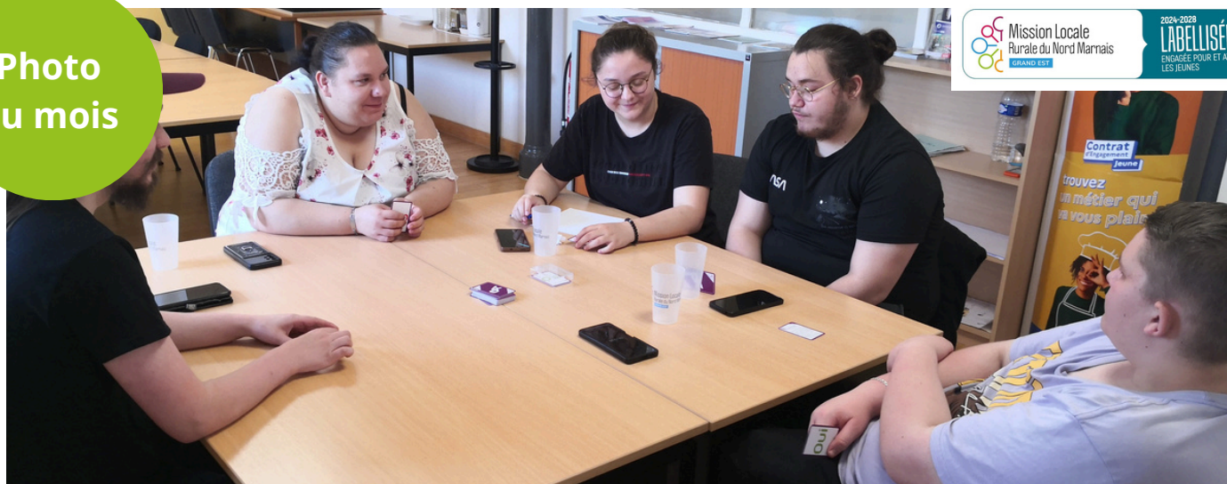
Photo du mois

La Gazette officielle de la Mission Locale Nord Marnais