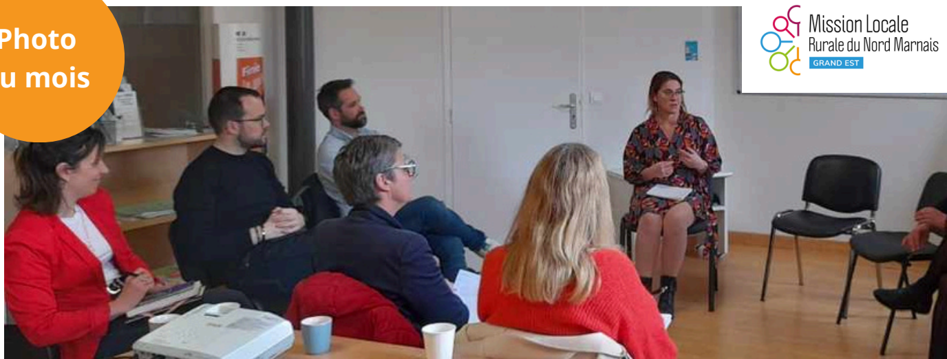
Photo du mois

Mission Locale Rurale du Nord Marnais GRAND EST