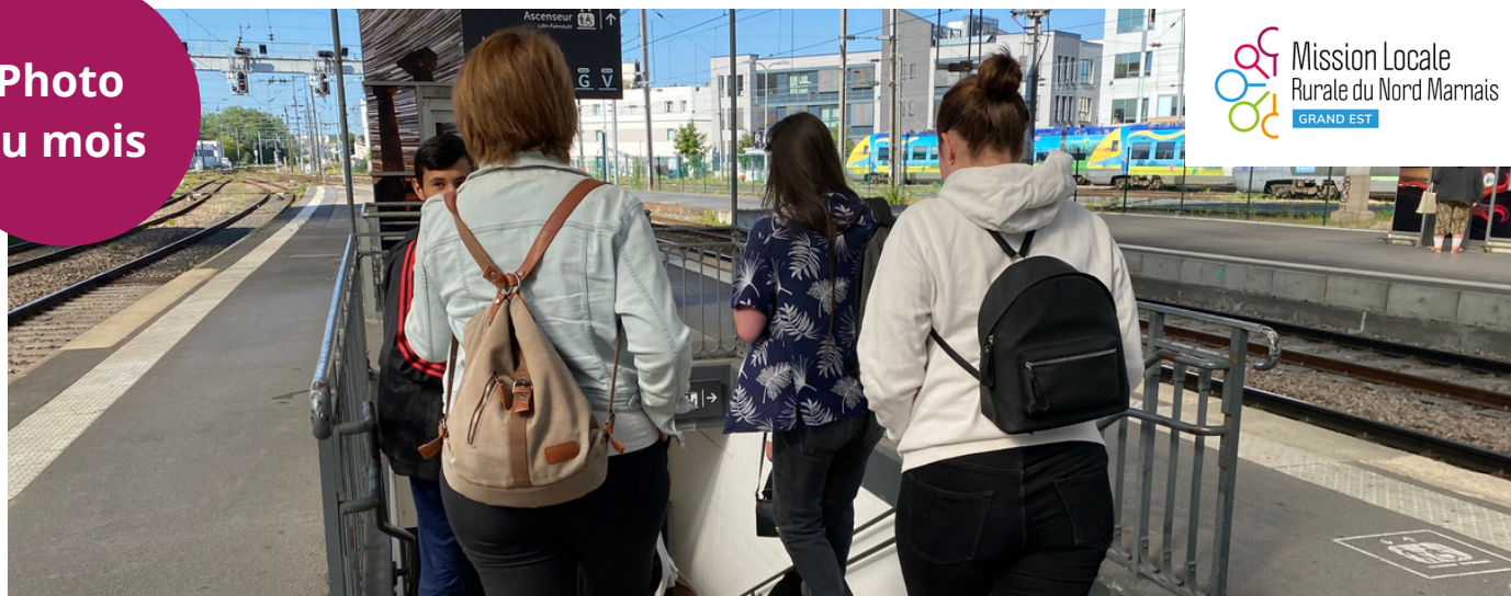
Photo du mois

Mission Locale Rurale du Nord Marnais GRAND EST