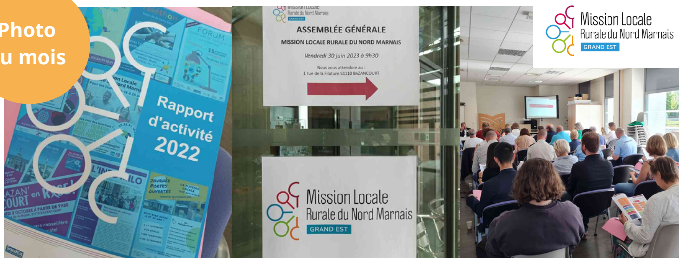
Photo du mois

La Gazette officielle de la Mission Locale Nord Marnais